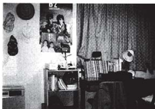
勉強機のまわりにはポスターが張られたり、帽子がかけられていたり…。子ども部屋らしい雰囲気を感じられる。